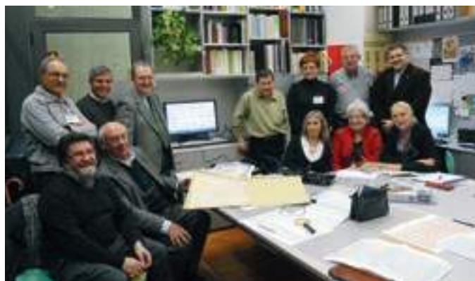
Novembre de 2010