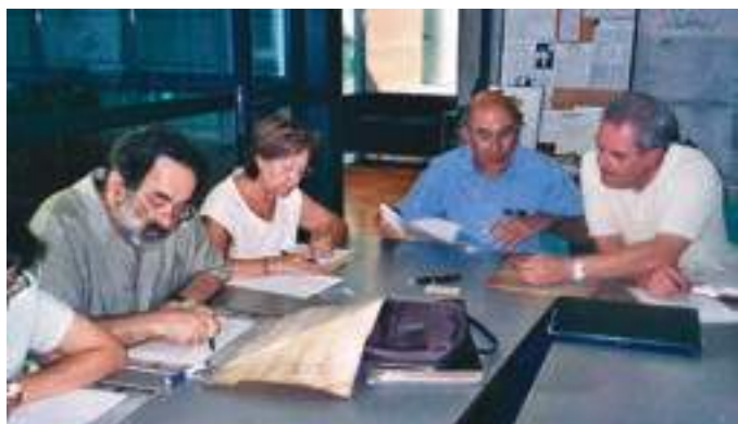
Grup inicial, curs 2002-2003