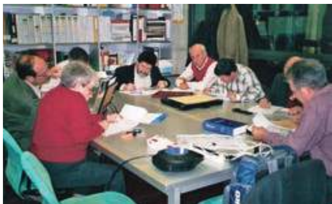
Març de 2017