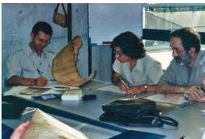
Grup inicial, curs 2002-2003