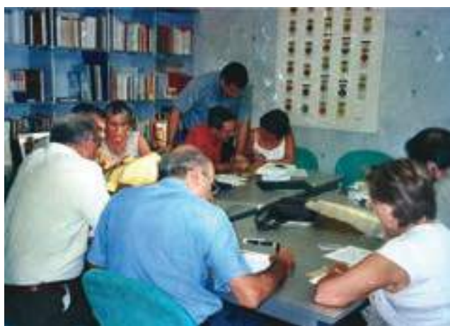
Grup inicial, curs 2002-2003