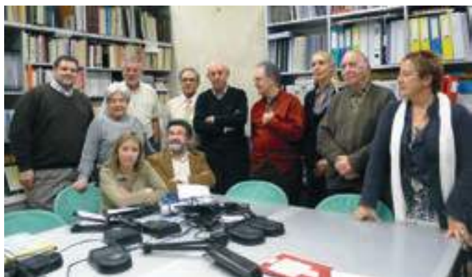
Febrer de 2009