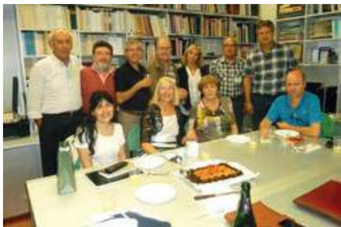
Març de 2018