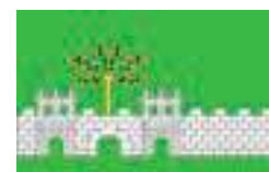
Bandera d' Ullastret (Baix Empordà) 21 de desembre de 2018 DOGC núm.7773