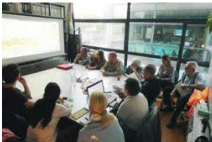
Març de 2019