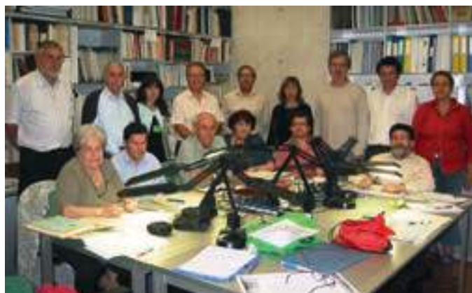
Juny de 2008